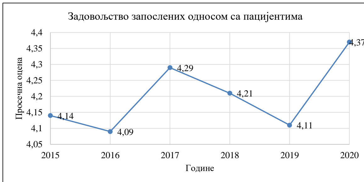
График 4. Просечна оцена задовољства запослених односом са пацијентима за период 2015-2020.

Задовољство запослених могућностима за професионални развој и континуирану едукацију се повећало у односу на 2019. годину (за 0,15 и износи 4,20). Задовољство се повећало и у апотекама у државном власништву (са 3,79 на 3,87), и у апотекама у приватном власништву (са 4,17 на 4,27). Задовољних и веома задовољних укупно је 83,1% док је незадовољних и веома незадовољних 5,4%. Веома задовољних могућностима за професионални развој и континуирану едукацију међу запосленима више је у апотекама у државном власништву него у апотекама у приватном власништву (44,8% наспрам 40,9%).