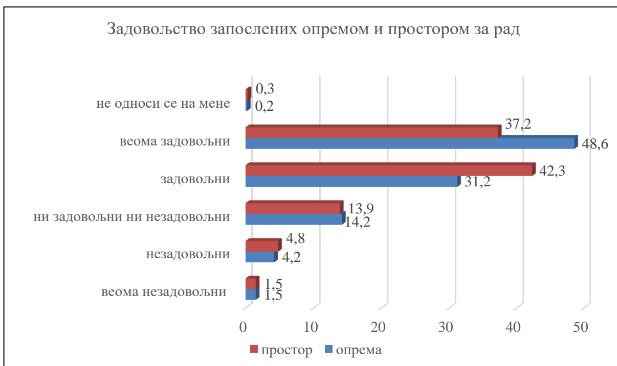
График 2. Задовољство запослених опремом и простором за рад

Задовољство запослених расположивим временом за рад износи 83,0% (задовољно 44,6% и веома задовољно 38,4%). Распоживим временом за рад задовољнији су запослени у апотекама у државном власништву (задовољни и веома задовољни 84,1% наспрам 82,4%). Веома задовољних расположивим временом више је у апотекама у државном власништву (55,6% наспрам 28,8%).