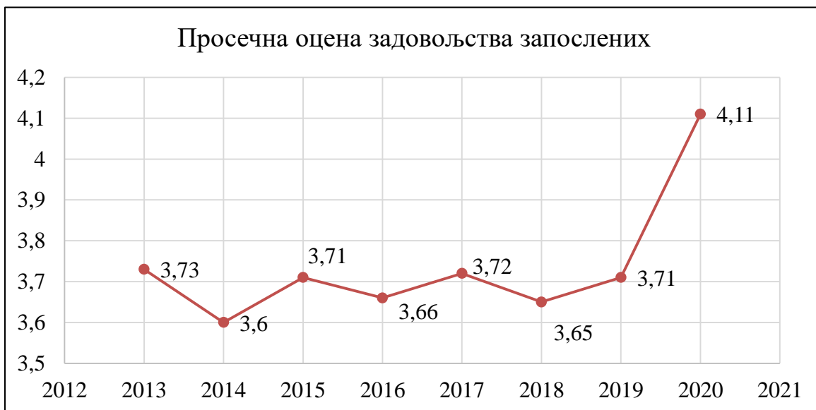
График 1. Просечне оцене задовољства запослених у апотекама за период 2013-2020. године

Узимајући у обзир све анализиране показатеље, највише је запослених веома задовољно послом 39,6% (више у апотекама у приватном власништву – 41,7% наспрам 35,7%). Веома незадовољних и незадовољних више је у апотекама у државном власништву (3,0% наспрам 0,5% односно 7,0% наспрам 2,1%). Запослени у апотекама у државном власништву су оценили задовољство послом са нижом просечном оценом (3,95), у односу на запослене у апотекама у приватном власништву (4,20). Задовољство послом се повећало код обе категорије апотека у односу на 2019. годину. У апотекама у