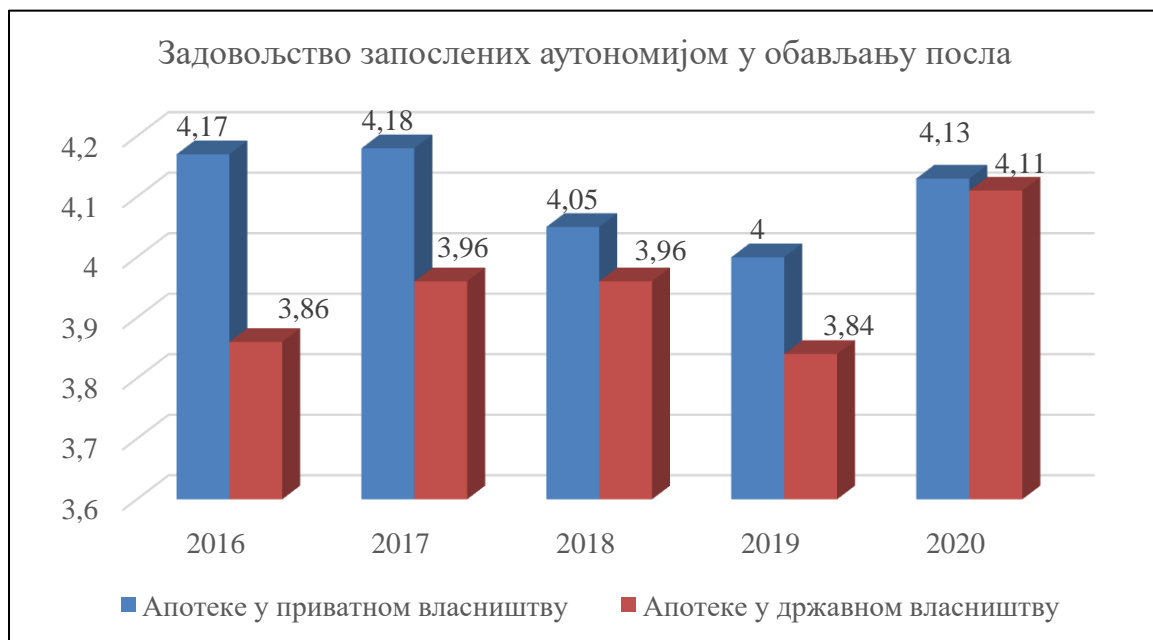
График 3. Задовољства запослених исказана кроз средње вредности за аутономију у обављању посла за период 2016-2020. године

Просечна оцена задовољства запослених уважавањем и вредновањем њиховог рада, у односу на претходну годину, знатно се повећала (за 0,51 и износи 4,29). Задовољство се повећало и код запослених у апотекама у државном (са 3,63 на 4,16) и приватном (са 3,84 на 4,36) власништву. Овим аспектом задовољних и веома задовољних било је 82,0%. Задовољних и веома задовољних више је било у апотекама у приватном власништву, него у апотекама у државном власништву (84,2% наспрам 77,9%).